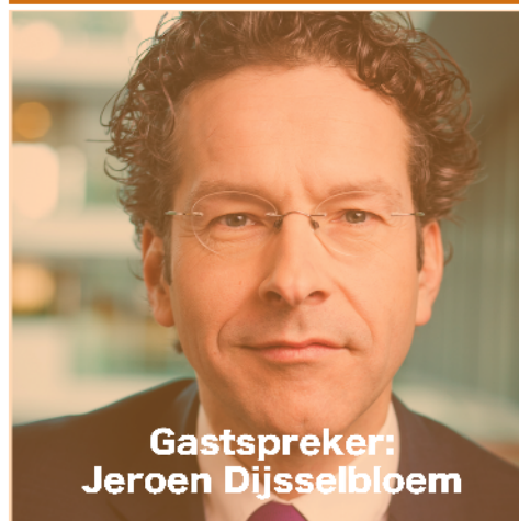
Gast spreker: Jeroen Dijsselbloem

Top 100 ondernemers tegen schulden problematiek