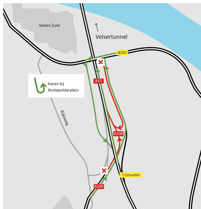
Afgesloten toerit Velsen-Zuid (N202) en Haarlem-Noord (A208): verkeer rijdt richting het zuiden en volgt de route via knooppunt Rottepolderplein richting Alkmaar.